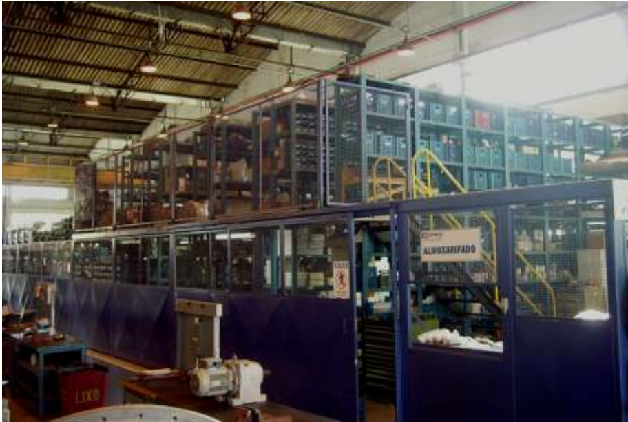
Peças de Reposição