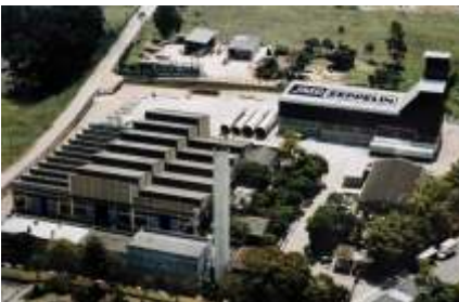
Vista aérea da fábrica